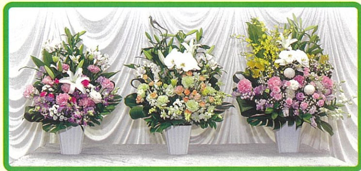
アレンジメントフラワー ⑥ 11,000 円 ⑦ 13,200 円 ⑧ 16,500 円