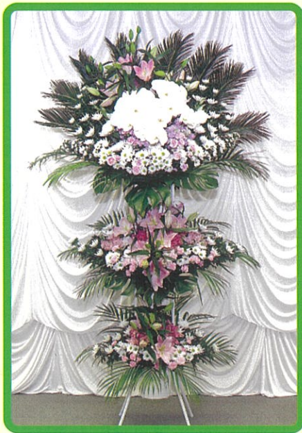
④ 生花 44,000 円