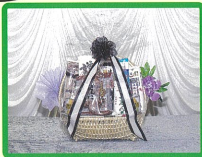
⑯ 6,600 円