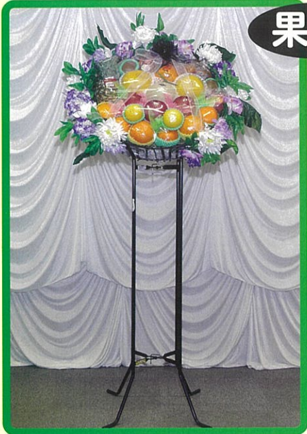
⑨ 16,500 円