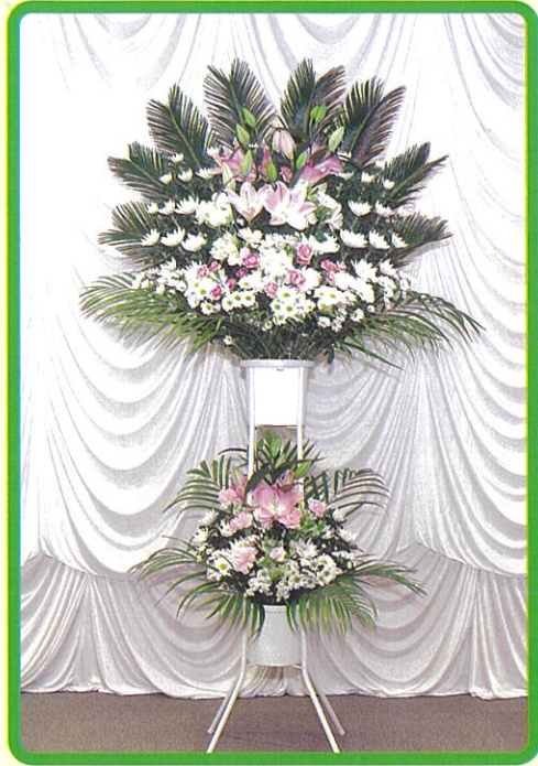
② 生花 22,000 円