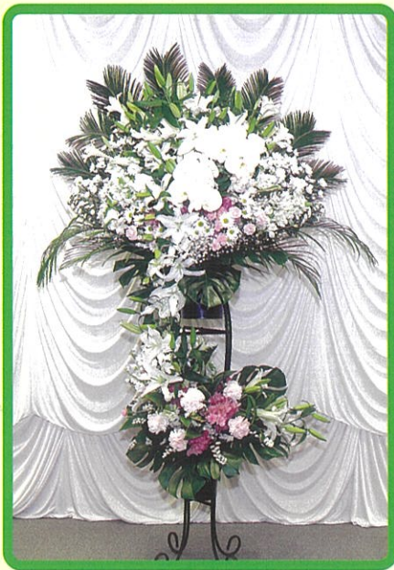
③ 生花 33,000 円