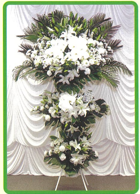
⑤ 生花 55,000 円