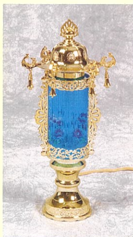
②⑧ バブル灯呂(31cm) 一対 14,300円