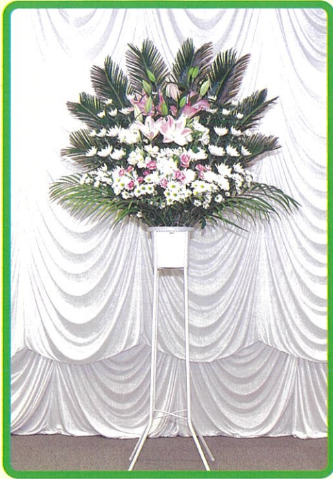
① 生花 16,500 円