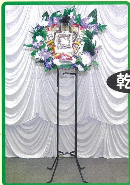
⑮ 16,500 円