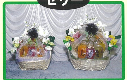
⑰ 6,600 円 ⑱ 11,000 円