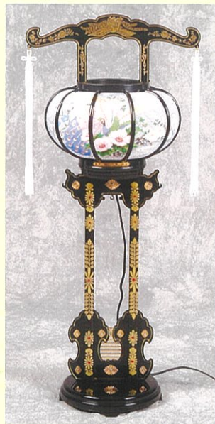
②⑥ 回転2本足1号(70cm) 一対 11,000円