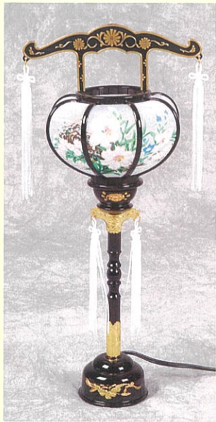
②④ 回転灯呂2号(40cm) 一対 6,050円