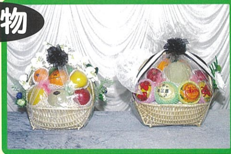
⑩ 6,600 円 ⑪ 11,000 円