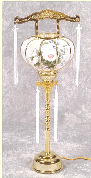
②⑤ 回転ゴールド4号(55cm) 一対 9,350円