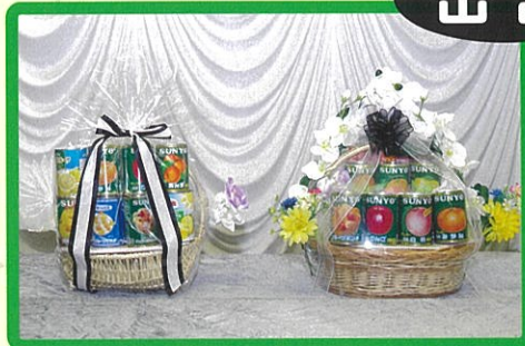
⑫ 6,600 円 ⑬ 11,000 円