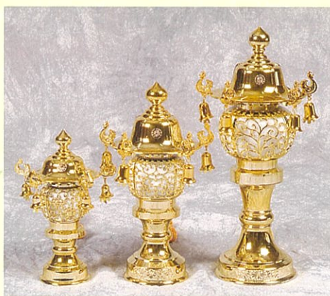
②⑨ ③① ③①