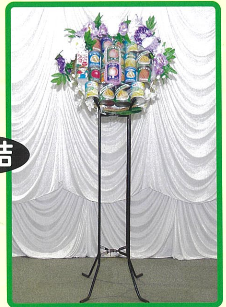
⑭ 16,500 円